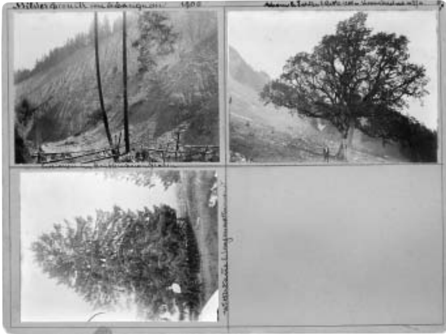
Abb. 11 Die Bilderchronik von Schangnau ist eine frühe Fotoserie, die eine dörfliche Landschaft festhielt. Ausser den verschiedenen Dorfteilen, den Häusern und Höfen waren auch spezielle Phänomene in der Landschaft von Interesse, wie hier etwa die Erosion in einem Graben oder der Kanonendurchschuss durch einen Ahorn im militärischen Übungsgelände. Anonym: Bilderchronik von Schangnau, 1908, Bogen Nr. 57, 3 Papierabzüge auf Karton, je ca. 8 x 11 cm.

65 Kartons umfasste, bestehen noch 49. Auf jeder der 18 x 24 cm grossen Tafeln sind bis zu vier Fotografien platziert, sorgfältig bezeichnet mit Datum, Thema und Bezeichnung der wiedergegebenen Örtlichkeit. Der grösste Teil der Aufnahmen zeigt Häuser und Höfe in den Dorfteilen und auf den Alpen. Etwa zehn der Kartons sind andern Themen gewidmet, so etwa Landschaften, speziellen Bäumen oder Szenen aus der Hausindustrie und der Landwirtschaft. Besonders Aufsehen erregend wirken heute Aufnahmen mit erodierten Geländeformen. Als Konvolut ist diese Bilderchronik allerdings rätselhaft. Über den Auftraggeber oder den Verwendungszweck lässt sich nur spekulieren. Es ist möglich, dass die Fotografien auch in der idyllischen Gegend im Schangnau letztlich mit drohenden zivilisatorischen Einflüssen zusammenhingen. Gerade zu jener Zeit bestanden Pläne, den Oberlauf der Emme beim Rebloch für die Stromgewinnung zu stauen. Der ganze Talgrund, damit ein beträchtlicher Teil der Matten und ein paar besonders schöne Höfe, wären unter den Wasserspiegel geraten. 120