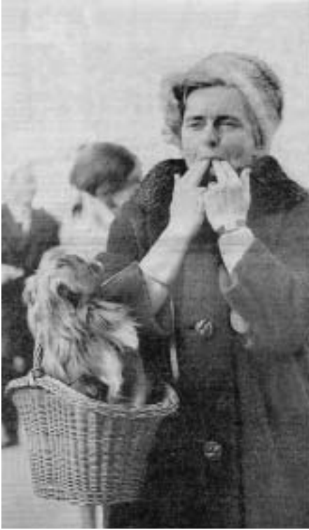
Abb. 1 «Hundchen staunt: pfeift seine Herrin an der Frauenstimmrechts-Kundgebung auf dem Bundesplatz in Bern dafür oder dagegen?», so lautete die Bildlegende im «Berner Tagblatt». Die Aufnahme von Hans Schlegel entstand am 1. März 1969 anlässlich der ersten Frauen-Demonstration auf dem Bundesplatz in Bern, zu der alle Frauenverbände der Schweiz aufgerufen hatten. Anstoss war der Antrag des Bundesrates, die Menschenrechtskonvention wegen des noch nicht durchgesetzten Frauenstimm- und -wahlrechts nur mit Vorbehalt zu unterzeichnen. Hans Schlegel (geboren 1934): Pfeifkonzert auf dem Bundesplatz, Bern, 1. März 1969, erschien im «Berner Tagblatt», 3. März 1969, Morgenausgabe, Seite 1, 23,7 x 13,8 cm.

ein ziemliches Durcheinander herrschte. Auf die Wohnräume, den Stall und die Scheune verteilt, war auf dem Hof alles untergebracht, was sich im Leben des Fotografen angesammelt hatte: alte Laboreinrichtungen und Haushaltgeräte, Schreibmaschinen, Computer, Möbel aus den letzten 50 Jahren, Geschäftsunterlagen und schliesslich die Fotografien und Negative zusammen mit denjenigen von Carl Jost. Auf den Schachteln und Kisten hatten sich im Lauf der Zeit Staub, Spinnweben, Mäusekot, dürre Blätter und Birkensamen abgelagert. Zwischen den Kartons und den Fotografien tummelten sich Silberfische. Vor ein paar Jahren hatte Schlegel einmal versucht, Ordnung in seine Sachen zu bringen. Zusammen mit einem Lehrling begann er mit dem Aussortieren von Belegexemplaren jener Zeitschriften und Zeitungen, für die er gearbeitet hatte, und wollte vieles der Abfuhr mitgeben. Niedergeschlagen hielt er die «Liquidation» in einem «Report einer Räumungsaktion» fest: «Ein ähnliches Schicksal wird in der nächsten Zeit mein Fotoarchiv ereilen, wie diejenigen meiner Kollegen. Einige wenige berühmte Fotografen können ihr Werk in einem Fotomuseum abgeben. Das sind aber nicht Alltagsfotos, sondern künstlerisch überhöhte Werke. Kleinigkeiten, wie sie von kleinen lokalen Fotografen dokumentiert werden, gehen im Strudel der Wichtigkeiten verloren.» 3