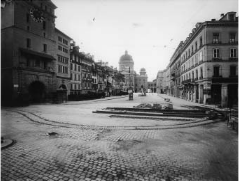
Abb. 10 1919 liess die Stadt Bern beim Käfigturm ein gepflastertes Strassenstück mit dem damals neu aufkommenden Asphalt überziehen. Während der Bauzeit mussten die Trams umgeleitet werden. Unterhalts- und Bauarbeiten gehören seit jeher zum Alltag einer Stadt. Viele Unternehmer und manchmal auch die Bauherrschaft liessen die verschiedenen Phasen fotografisch dokumentieren und am Schluss in Alben zusammenstellen. Anonym: Provisorische Tramführung beim Käfigturm, Bern, anlässlich der Asphaltierung, 18. Juli 1919, Papierabzug 16,7 x 22,6 cm.

das in den allermeisten Fällen aber in eine andere Richtung zielt, als Fluri sie als Fotografiehistoriker vertrat. Nicht anders als im privaten Rahmen spielen Fotografien für die Bewohner von Städten und Dörfern eine zentrale Rolle als Medium des Erinnerns. Sind die Aufnahmen im Familienkreis «Unterpfand verfloßener Gemeinsamkeit» 100 , so legen Ortsbilder und Landschaften Zeugnis ab über die rasante Veränderung der Siedlungsräume. Je nach Optik sind solche Fotografien Ausdruck von Fortschrittsglauben, Beweis für die fortschreitende Zerstörung von Tradition und Heimat oder einfach Anlass zu Wehmut und Nostalgie. Selbst in einem relativ kleinen Gebiet wie dem Kanton Bern ist die Zahl an Bildbänden, Fotopostkarten und Kalendern mit historischen Dorf- und Stadtansichten fast unüberschaubar. Die meisten dieser Druckwerke zeigen zwar reizvolle Aufnahmen und erfüllen eine wichtige dokumentarische Rolle. Fotografiegeschichtlich ist ihre Bedeutung manchmal zweifelhaft und beschränkt.