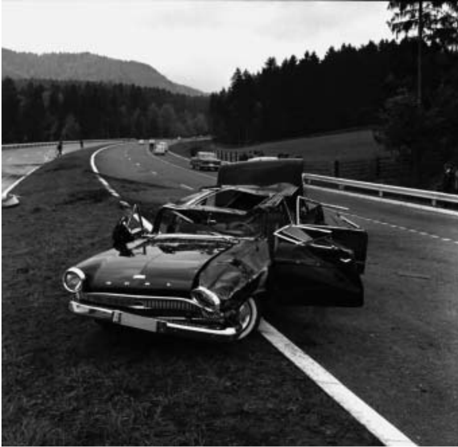
Abb. 6 Walter Nydegger war für seine Unfall- und Katastrophenbilder berühmt. Zu Feuerwehr und Polizei hatte er gute Kontakte; häufig traf er noch vor diesen auf den Schadenplätzen ein. Kurz nach der Eröffnung der Autobahn N1 im Mai 1962 hielt er den ersten tödlichen Unfall auf der Strecke beim Grauholz fest. Seine Notiz zum archivierten Negativ lautet: «Erster Unfall auf der Autobahn N1 beim Grauholzdenkmal mit Todesfolge. Auto mit 140 km überschlagen, bei Vorfahrmanöver, ein Toter und eine Verletzte, Mai 1962». Walter Nydegger (1912–1986): Durchlichtscan ab Negativ 6 x 6 cm.

der lokalen Redaktionen konnte es sich schliesslich leisten, ihre an der Ausstellung beteiligten Reporter im Stich zu lassen. 54