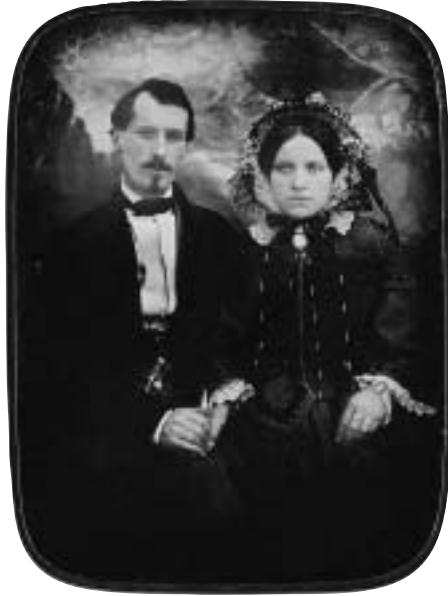
Abb. 9 Anhand des Hintergrundes ist diese Paaraufnahme dem Stadtberner Carl Durheim zuzuschreiben. Durheim arbeitete in seiner Frühphase auch als Wanderfotograf ausserhalb der Stadt, so etwa in Burgdorf, im Emmental oder im Berner Oberland, woher vermutlich die Aufnahme stammt. Carl Durheim (1810–1890), zugeschrieben: Paar um 1850, Daguerreotypie, koloriert, 7 x 9 cm.

von Heimatlosen weltweit eine Sensation dar. Gleichzeitig ist der anlässlich der Ausstellung erschienene Bildband ein gelungenes Beispiel für die Notwendigkeit und den Erfolg einer profunden fotografiehistorischen Vorgehensweise. 82